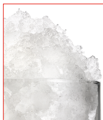
Hielo tipo frappé